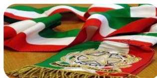
Gli Enti e le Istituzioni