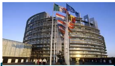
Consiglio d'Europa DH-BIO