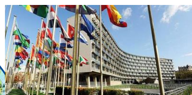
Comitato internazionale di Bioetica dell'UNESCO Parigi

Il CNB partecipa regolarmente a riunioni con Organismi ed Istituzioni internazionali